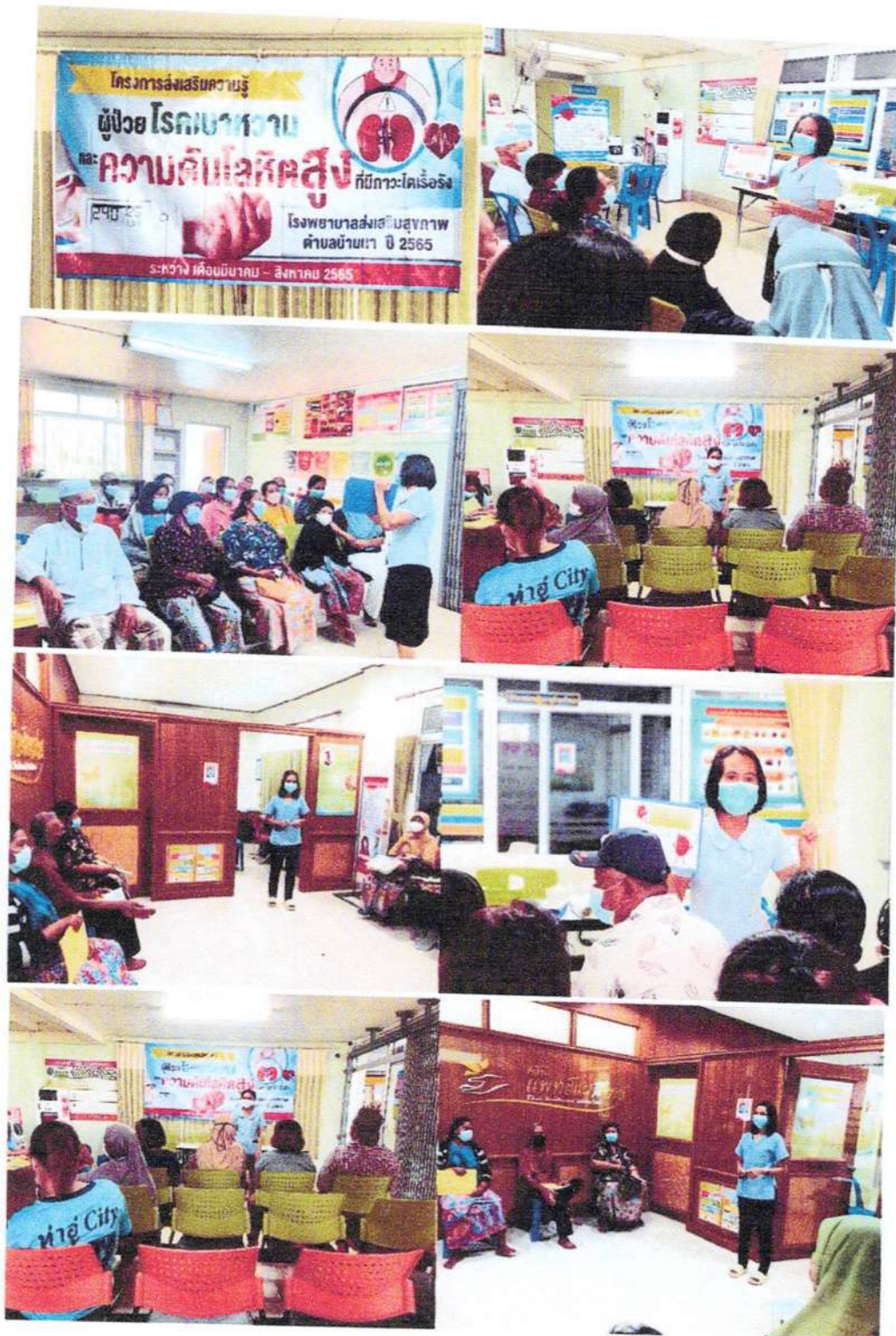
กิจกรรมให้ความรู้เรื่องโรคไตเรื้อรัง แก่ผู้ป่วยเบาหวาน ความดันโลหิตสูง