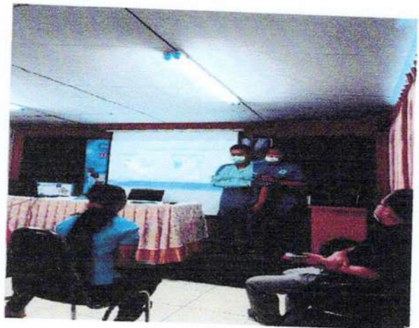
ภาพที่ ๑๓ - ๑๘ วิทยากรให้ความรู้การปฐมพยาบาลเบื้องต้น และการช่วยฟื้นคืนชีพขั้นพื้นฐาน