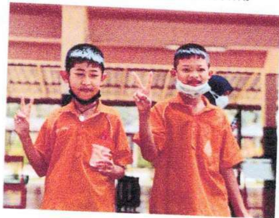
กิจกรรมยิ้มสีฟัน+แปรงฟัน