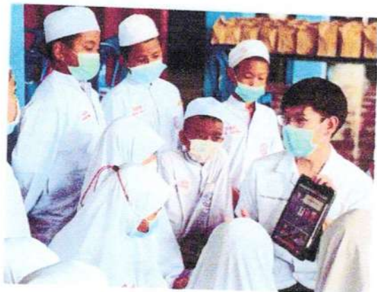
ให้ทันตสุขศึกษารายกลุ่ม