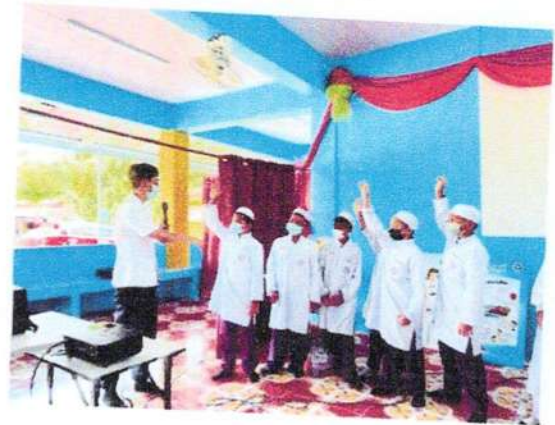
ตอบคำถามชิงรางวัล