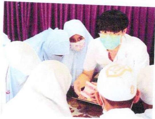
ให้ทันตสุขศึกษารายกลุ่ม