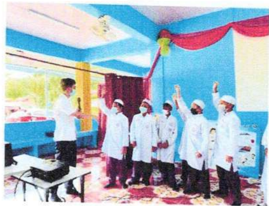
ตอบคำถามชิงรางวัล