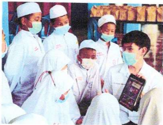
ให้ทันตสุขศึกษารายกลุ่ม