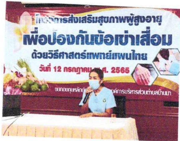
กล่าวเปิดโครงการโดย ผอ.รพ.สต