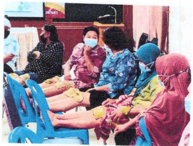
นั่งพบปะพูดคุยแลกเปลี่ยน