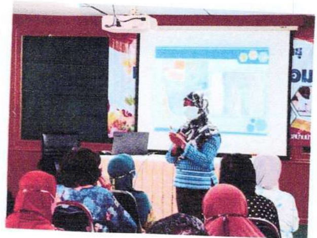
วิทยากรให้ความรู้เกี่ยวกับผู้เข้าร่วมโครงการ