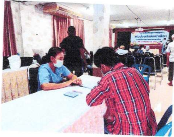
ลงทะเบียนเข้าร่วมโครงการ