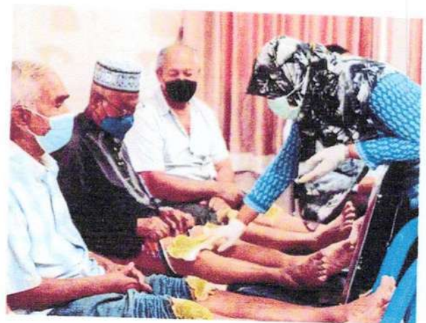
พอกยาสมุนไพรเพื่อรักษาอาการปวดเข่า