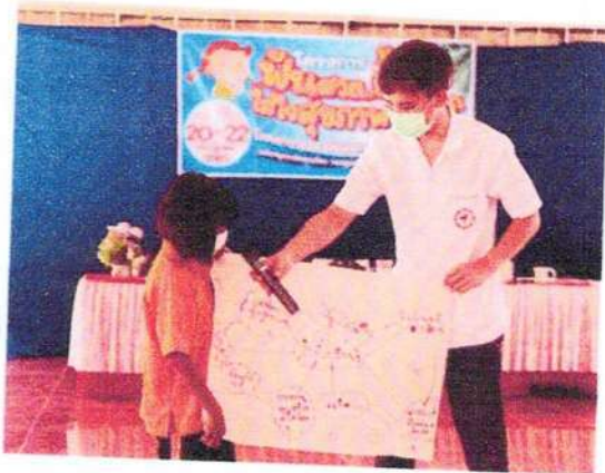
นำเสนอผลงานกลุ่ม