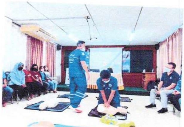
ภาพที่ ๑๙ - ๒๔ การฝึกปฏิบัติการช่วยฟื้นคืนชีพ