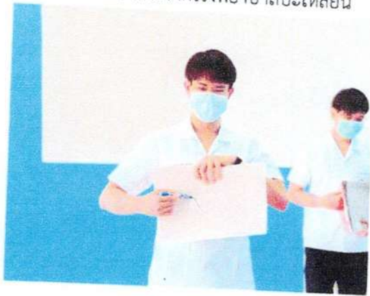
เกมวาดภาพ