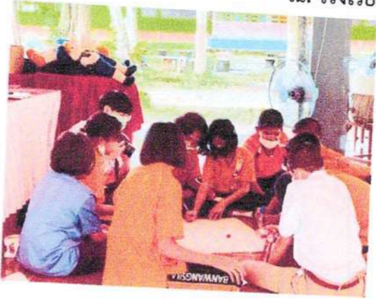
ให้ทันตสุขศึกษารายกลุ่ม