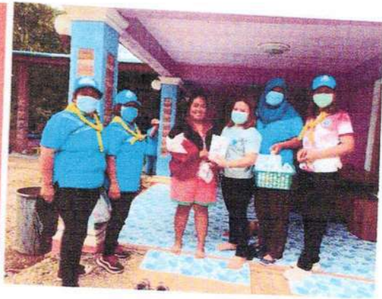
เจ้าหน้าที่ และอสม. ลงพื้นที่รณรงค์ใช้เลือดออกสำรวจลูกน้ำยุงลาย ให้ความรู้และแจกวัสดุอุปกรณ์ในการป้องกันโรคไข้เลือดออก แก่ชาวบ้าน