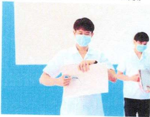
เกมวาดภาพ