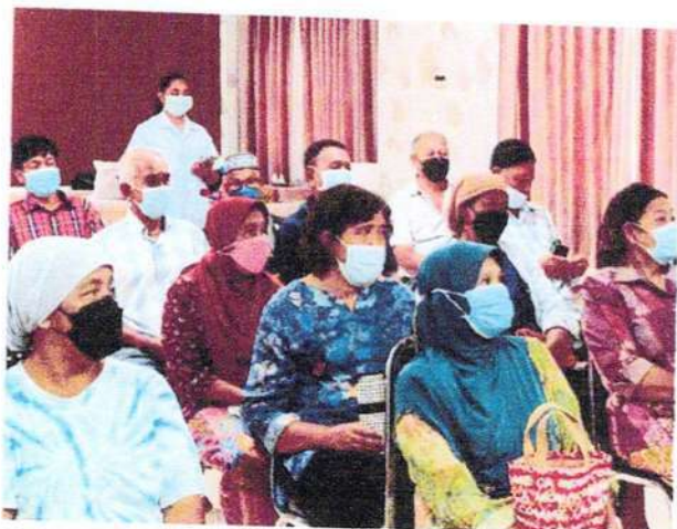
ผู้เข้าร่วมโครงการรับฟังบรรยายความรู้เกี่ยวกับข้อเข่า