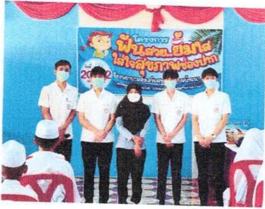
วิทยากร โครงการจากโรงพยาบาลปะเหลียน