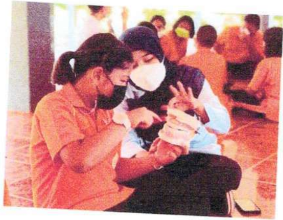
กิจกรรมสอนการแปรงฟัน