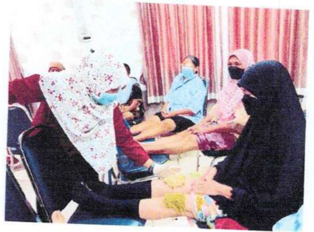
พอกยาสมุนไพร