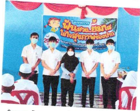
วิทยากร โครงการจากโรงพยาบาลปะเหลียน