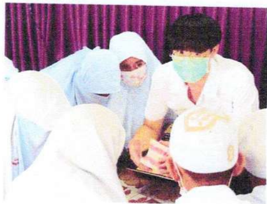
ให้ทันตสุขศึกษารายกลุ่ม