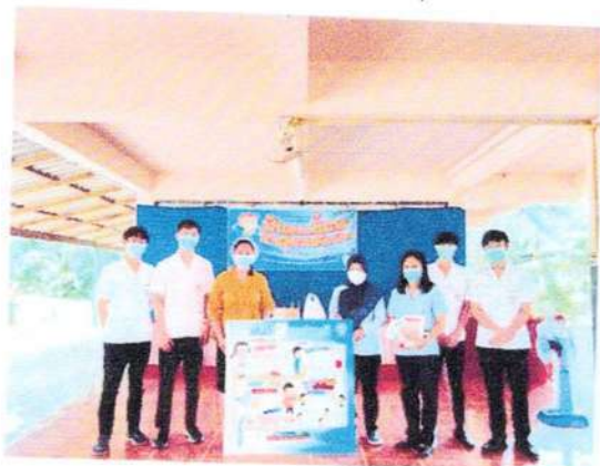
มอบสื่อทันตสุขศึกษาแก่โรงเรียน