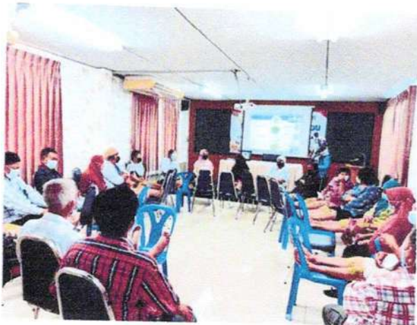
รอยาพอเข้าห้อง